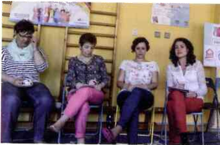
Pracovní setkání v Chaloupce.