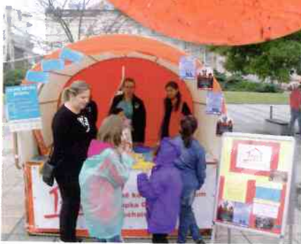
Tátafest - pocta hlavám rodiny.